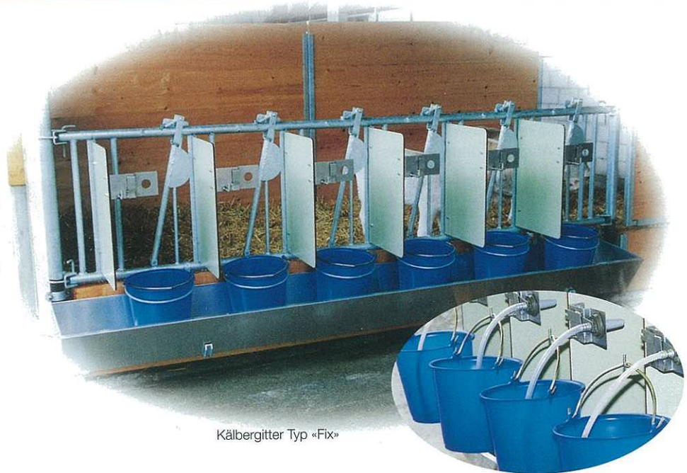
Kälbergitter Typ «Fix»